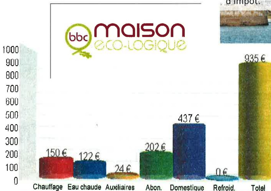
Tableau de consommation pour une maison de 105 m 2